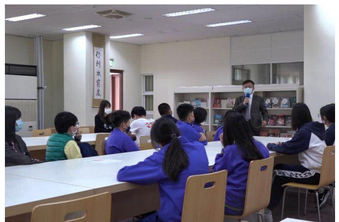
校長愛的期勉與鼓勵：開卷有益