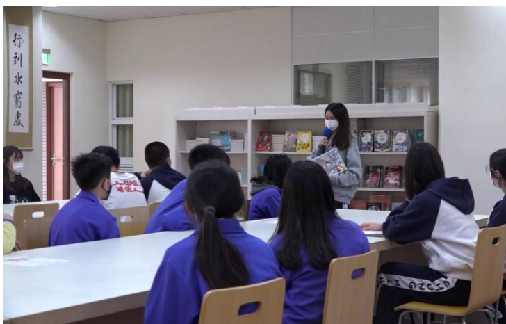
高 201 英文閱讀心得創作分享