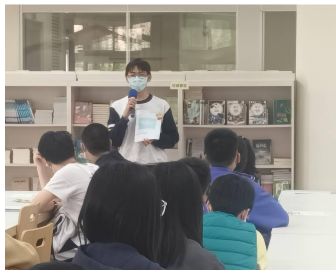
高 203 日文書籍閱讀心得創作分享