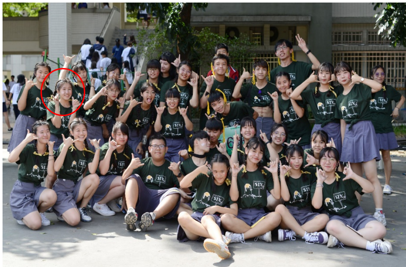
高二上學期啦啦舞比賽 賽後合照