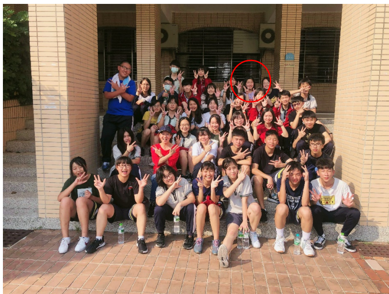
高一下學期班際籃球比賽 賽後合照