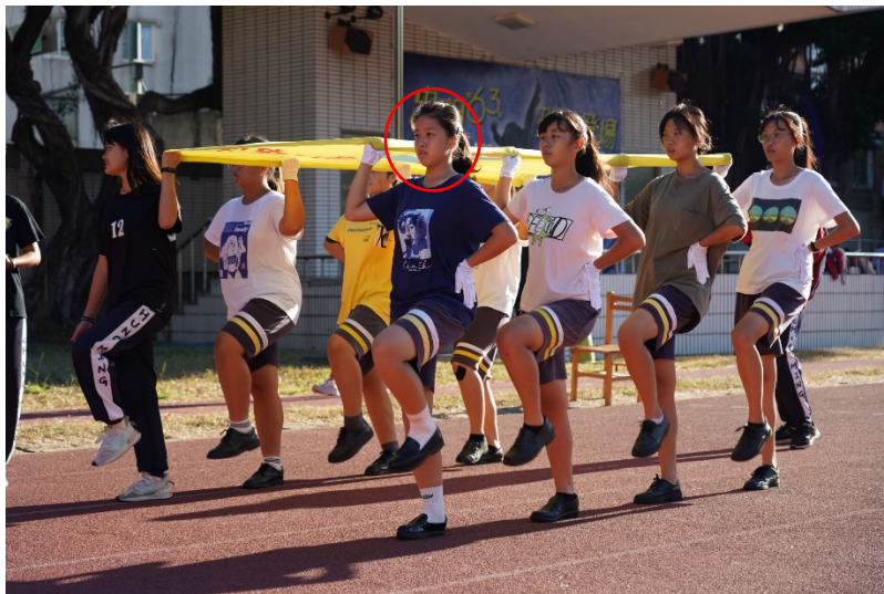
校旗隊早晨訓練的身影