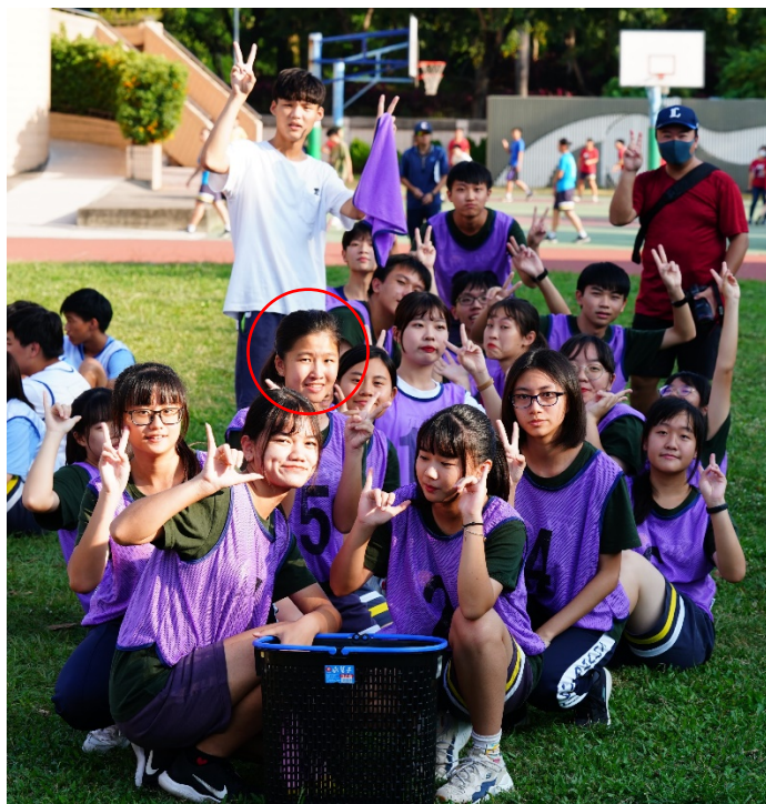
高二上學期大隊接力比賽 賽前合照