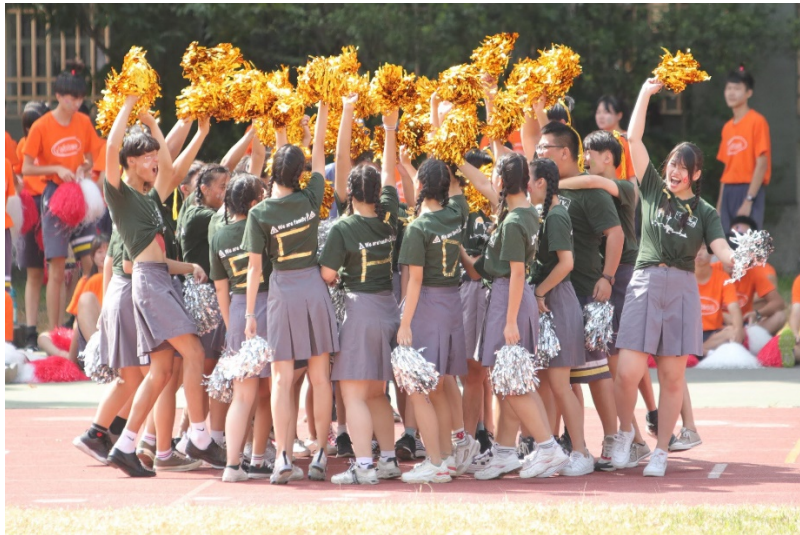
高二上學期啦啦舞比賽 賽前喊加油口號的畫面